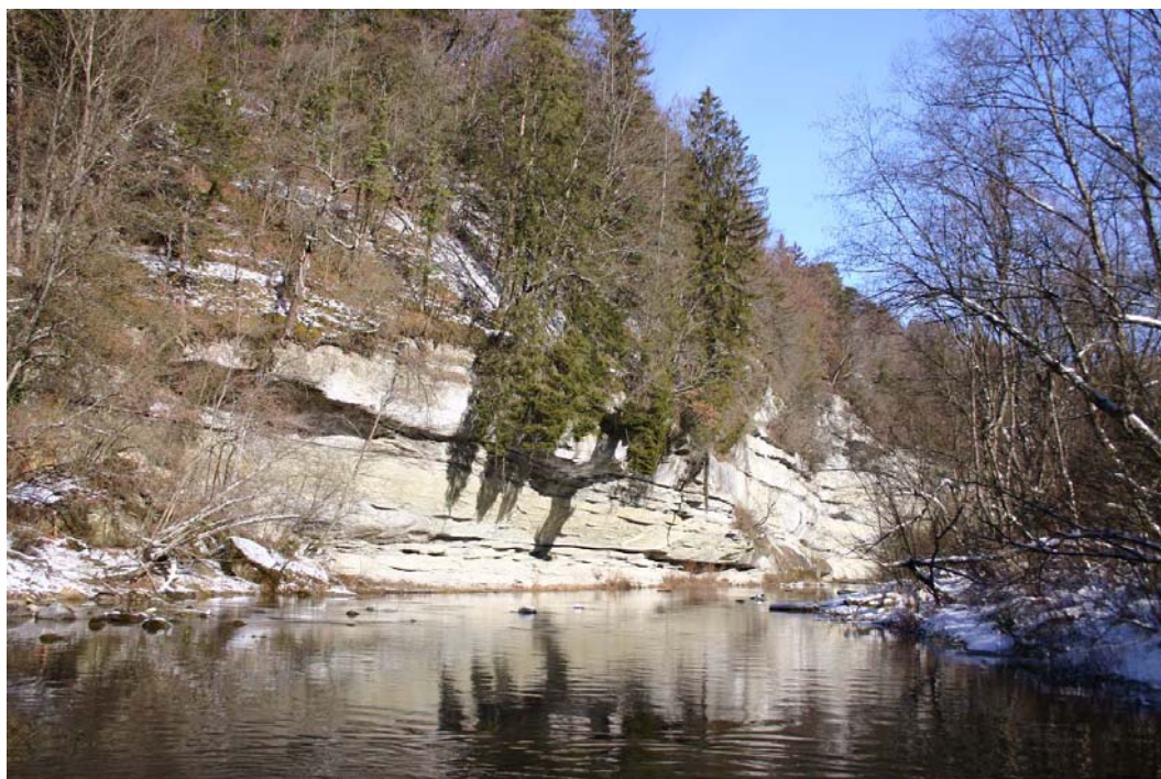
La Petite-Sarine à Illens