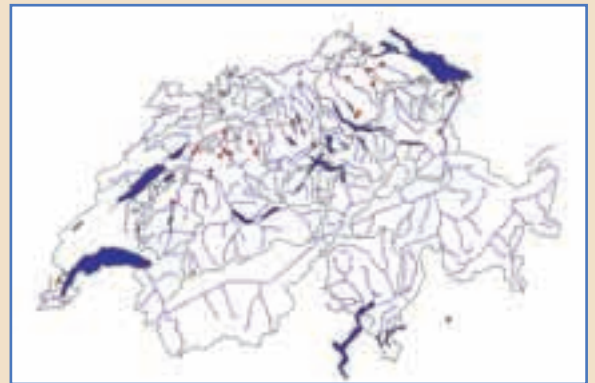
Abbildung 1: Nachweis der Proliferativen Nierenkrankheit (PKD) in der Schweiz in den Jahren 1979-1999 (ohne Fischzuchtanlagen).

Fließgewässer ein Laichfischfang durchgeführt wird. Werden gefangene Elterntiere anschliessend in Anlagen gehalten, ist anzunehmen, dass es zu Kontakten zwischen Fischen aus Gewässern mit und solchen ohne PKD kommt. Solange der Zyklus der Krankheitserreger noch nicht vollständig abgeklärt ist, kann eine Übertragung nicht vollständig ausgeschlossen werden.