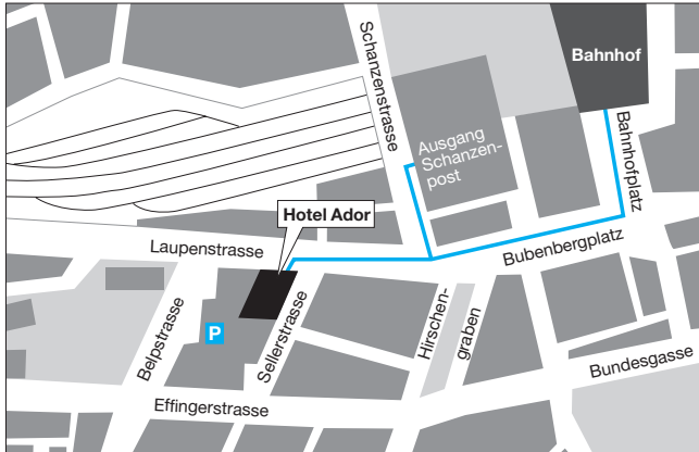
Hotel Ador, Laupenstrasse 15, 3001 Bern, Tel. 031 388 01 11

Das Projekt «Netzwerk Fischrückgang Schweiz» wurde Ende 1998 gestartet. Beteiligt sind die EAWAG, das BUWAL, der Schweizerische Fischerei-Verband, die Schweizerische Gesellschaft für Chemische Industrie, alle Kantone und Liechtenstein. Das Projekt zielt auf die Ursachenanalyse des Fischfangrückgangs und der beobachteten verschlechterten Fischgesundheit und die Entwicklung von Massnahmenvorschlägen. Am Abschluss-Symposium werden die Resultate im Überblick vorgestellt und der Schlussbericht veröffentlicht.